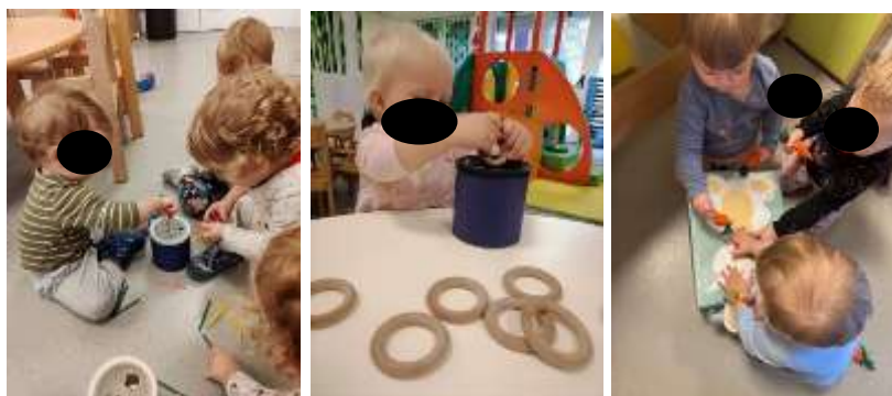
Slika 20. Ubacivanje predmeta u otvor; razvoj fine motorike

Djeca intenzivno razvijaju krupnu i finu motoriku kroz kretanje, istraživanje prostora i manipulaciju predmetima. Kroz svakodnevne aktivnosti i poticajno okruženje osiguravamo uvjete za njihov cjelokupni tjelesni i psihomotorni razvoj. Nekoliko djece pridružilo se skupini kao nehodač, no uz poticajno okruženje i podršku odgojitelja, u kratkom su vremenu samostalno prohodala unutar vrtićkog prostora. Razvoj fine motorike poticali smo raznovrsnim didaktičkim igračkama i materijalima koji su djecu poticali na hvatanje, umetanje, slaganje i precizne pokrete prstima i šakama. Razvoj grube motorike poticali smo svakodnevnim tjelesnim aktivnostima, posebno kroz penjanje i silaženje s tornja te spuštanje s tobogana. Kroz takve pokrete djeca su postupno usvajala i usavršavala osnovne oblike kretanja poput hodanja, trčanja, penjanja i održavanja ravnoteže.