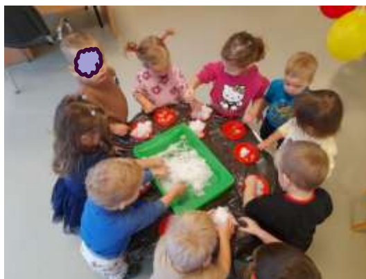
Slika 25. istraživanje snijega u plitkoj kadici

Djeca rado i s veseljem pristupaju razvrstavanju kockica u građevnom centru, gdje odvajamo spužvaste, gumene, velike plastične i lego-duplo kockice. Vrlo su ponosni na svoja postignuća sortiranja. Različite slikovnice pomogle su djeci da povežu značenje određenog teksta, slike, pažnju i koncentraciju, te stječu nove spoznaje putem vizualnih i slušnih doživljaja. Kroz godinu nudile smo im i razne umetaljke, premetaljke, puzzle, slagalice i male mozgalice u sastavljanju dijelova životinja, što s velikim interesom pronalaze i sastavljaju.