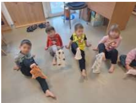
Slika 34. Hvatanje krpice nožnim prstima

Svakodnevnim promatranjem i planiranjem aktivnosti potičemo optimalan psihomotorički razvoj svakog djeteta, uvažavajući individualne sposobnosti.