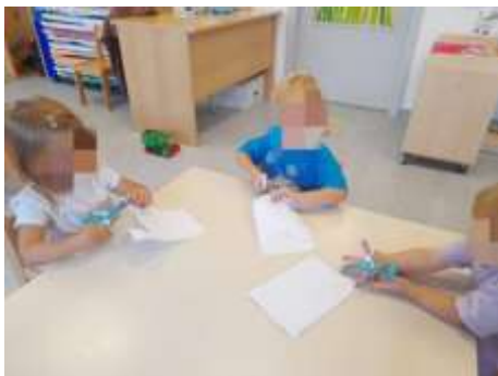
Slika 13. Razvoj fine motorike