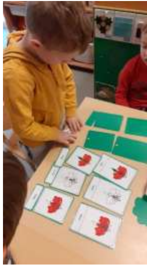
Slika 78. Montessori jezična igra za poticanje govora te početnog čitanja i pisanja

Izražavanje i stvaranje- djeca su kroz likovne, glazbene i dramske aktivnosti izražavala svoje doživljaje, emocije i ideje.