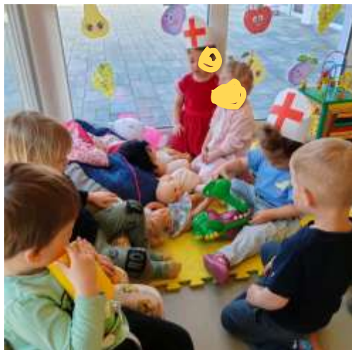
Slika 66. Centar liječnika, igra uloga

Kao poticaj djeci u odvikavanju od pelena, odgojiteljice su prikupile nekolicinu slikovnica s tematikom pelena i korištenja toaleta. Smatramo kako su slikovnice imale vrlo veliki utjecaj na razmišljanje i percepciju djece.