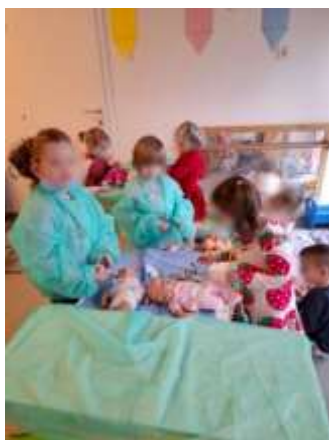
Slika 33. Simbolička igra liječnika

Nadalje, fina motorika sitnih mišićnih skupina šake i stopala razvijala se, većim dijelom, kroz aktivnosti manipuliranja sitnim materijalima i poticajima, ponajviše perlicama, gumbima, štipaljka, pomponima, vatom i pincetama, rižom, setovima za konstruiranje, provlačenjem tankog užeta kroz rupice, izrezivanjem škarama, korištenjem medicinskih materijala u igri (flasteri, zavoji, šprice, otvaranje i zatvaranje posudica za kreme, „pisanje“ po računalnoj tipkovnici i slično) u centru liječnika te hvatanjem krpica i loptica nožnim prstima. Navedene aktivnosti bile su vrlo dobar način za uvježbavanje pravilnog držanja olovke ili bojice što je kod većine djece i usvojeno.