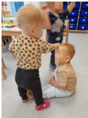
Slika 17. Poticanje empatije

Nastojale smo zadovoljiti emocionalne potrebe djece-osjećaj sigurnosti, zaštićenosti, pripadnosti, stvaranje pozitivnih odnosa unutar skupina, dobivanje priznanja i pohvala. Trudile smo se biti dobar model ponašanja, poticale djecu na suradnju, razvoj prijateljstva, poštovanje prema odraslima i među djecom. Kod mlađe djece interakcija se još uvijek bazira na razini odgajatelj – dijete, jako rijetko dijete – dijete. Odgajatelj ima veliku ulogu u interveniranju kod čekanja na red, dijeljenju igračkaka i sličnim situacijama.