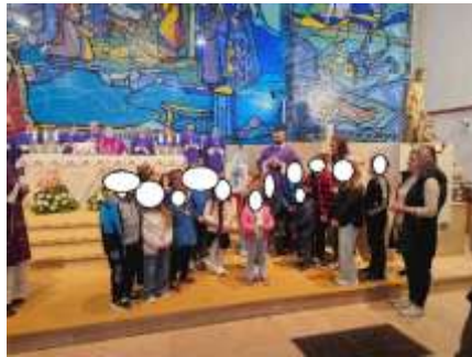
Slika 50. Hodočašće u Nacionalno svetište Svetog Josipa u Karlovac

„Gudlin“.Povodom Dana dobrih djela posjetili smo Dom za starije i nemoćne „Mesmar“ u Prelogu te pjesmama i plesom razveselili osobe u njemu. U ožujku smo obilježili Očev dan hodočašćem u Karlovac u Nacionalno svetište Svetog Josipa na koji smo išli zajedno sa roditeljima i djecom, a predvodio nas je svećenik D.C. Bilo je to jedno prekrasno druženje, a nakon duhovnog dijela putovanja posjetili smo Slatkovodni akvarij u Karlovcu te tako zaokružili naše putovanje. Osim toga sudjelujemo i na svetim misama povodom blagdana Svetog Nikole, Božića-blagoslov djece, Majčin dan, Očev dan te Tijelovo.