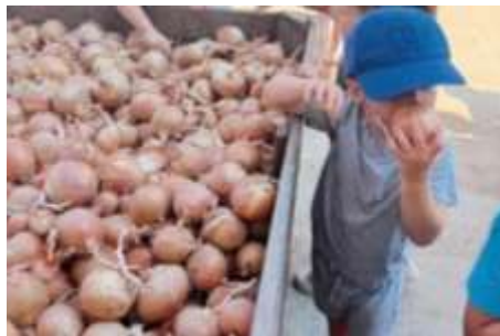
Slika 46. Iskustveno istraživanje mirisa

Spoznajni razvoj kod većine djece u skladu je sa njihovom kronološkom dobi.