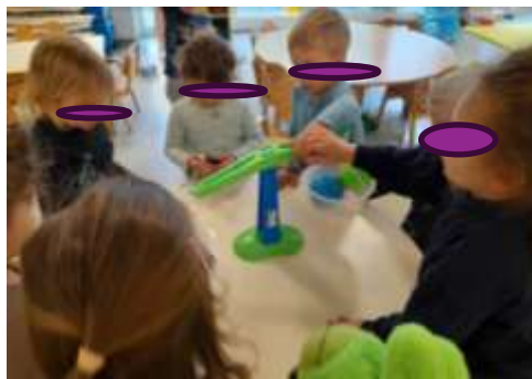
Slika 64. veće-manje, teže-lakše