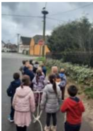
Slika 72. Učenje u prirodnom okruženju – vratila se roda

Spoznajni razvoj djece u velikoj je mjeri ovisan o neposrednom okruženju vrtića u kojem smo gotovo svakodnevno boravili. Tako su djeca stjecala iskustva uočavanjem i istraživanjem veza i odnosa među pojavama u prirodi. Stečena znanja i iskustva kao i ona donesena od kuće djeca često međusobno razmjenjuju i uspoređuju. Pojedina djeca pokazuju interes za brojeve, prepoznaju i imenuju ih te pridružuju količine. Nekolicina djece počela je s usvajanjem predčitalačkih vještina, prepoznaju i imenuju slova. Većina djece je napredovala, stekla određenu količinu znanja, razvijala i usmjeravala svoje interese koje smo rado pratili dodatnim materijalima, aktivnostima i sadržajima. Pojedina djeca i dalje imaju teškoće sa koncentracijom pri bilo kojoj aktivnosti pa često i ostalu djecu ometaju u slušanju uglavnom govornih aktivnosti. Najviše novih spoznaja djeca su usvojila kroz igru u prirodnom okruženju i to kroz istraživačke i životno praktične aktivnosti.