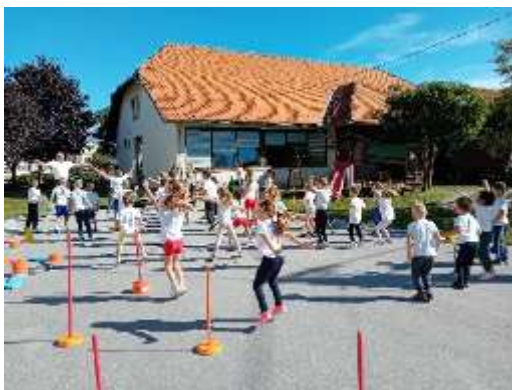
Slika 56. Suradnja sa OŠ, Obilježavanje Olimpijskog dana