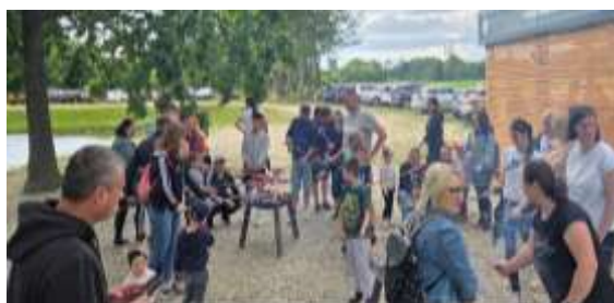
Slika 115.Slika 12. Suradnja s roditeljima

Suradjujući s užom i širom zajednicom, djeca su stekla široku lepezu poticaja, iskustva i spoznaja te su razvila afirmativni identitet i osnažena za aktivno uključivanje i sudjelovanje u kulturnom i društvenom životu zajednice.