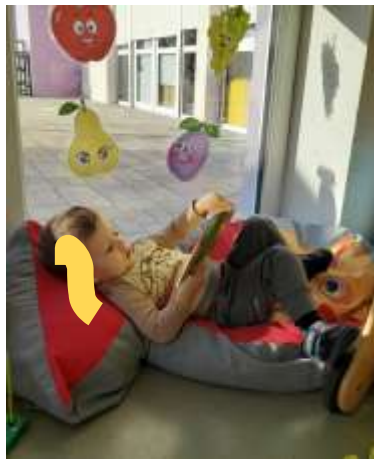
Slika 60. Centar početnog čitanja i pisanja

zemljom. Također, na terasi smo razvijali cjelokupnu tjelesnu sposobnost kroz razne poligone, igre s loptom i slobodne oblike kretanja koji uključuju penjanje, trčanje, spuštanje, provlačenje, skakanje, hodanje po uskoj površini i sl. Kako smo s djecom prošle godine svakodnevno vježbale i učile kako treba kulturno šetati s užetom, ove godine napokon smo dočekali da smo dovoljno spremni i veliki da izađemo u šetnju okolicom vrtića. Aktivni smo bili u toplijim mjesecima s šetnjama po dvorištu i okolici vrtića. Djeca su u šetnji bila vrlo doživljajna, sve ih je oduševljavalo te su primjećivali i komentirali događanja oko sebe.