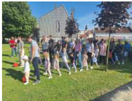
Slika 38. Suradnja s roditeljima

Kako bismo svakodnevnu komunikaciju učinili bržom i pristupačnijom, koristili smo zajedničku Viber grupu putem koje su roditelji redovito dobivali informacije, fotografije aktivnosti i važne obavijesti. Isto tako, tijekom godine održano je 15 individualnih razgovora s roditeljima. Ti su sastanci omogućili detaljniji uvid u napredak svakog djeteta, ali i razmjenu mišljenja, prijedloga i iskustava.