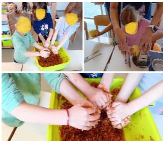
Slika 96. Priprema pite od jabuka

Rješavanjem radnih listića svakodnevno smo kod djece poticale razvoj pozornosti, pamćenja i operativnog mišljenja. Grupnim načinom rada poticale smo kod djece slušanje, fokusiranje na zadani zadatak te samostalno rješavanje istih. Šetnjama gradom uočavali smo promjene u prirodi i našoj okolini te pratili kako se priroda mijenja dolaskom novog godišnjeg doba. Pojmove kao što su doba dana, dani u tjednu, mjeseci u godini, godišnja doba, vremenske prilike usvojila je većina djece, te shvaćaju njihov odnos.