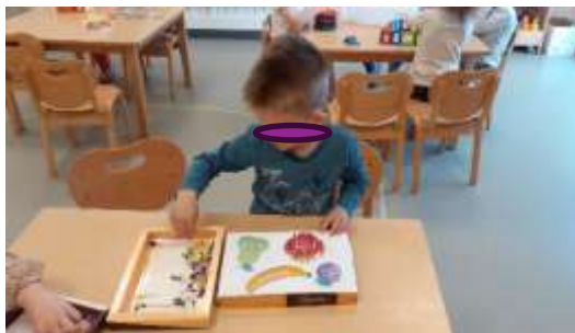
Slika 75. fina motorička aktivnost kojom se potiče razvoj pincetnog hvata