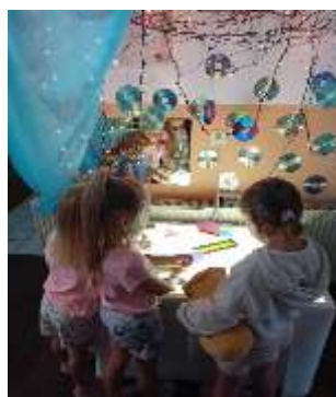
Slika 49. Istraživačka aktivnost svjetla, sjene, boja i oblika pomoću svjetleće kutije