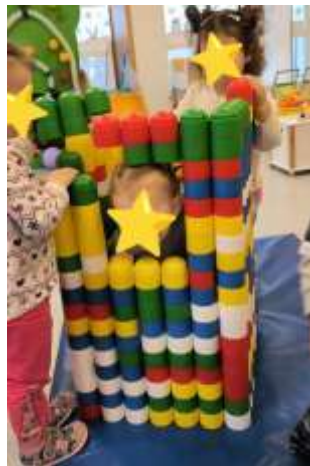
Slika 1. Igra u paru

S obzirom na broj djece u grupi, uvjeti za ostvarivanje plana i programa bili su iznimno dobri. Bilo je moguće posvetiti se svakom djetetu, zadovoljiti potrebe svakog ponaosob. Materijalni i organizacijski uvjeti također su bili više nego dobri. Dostupnost materijala omogućilo je nesmetano pripremanje i nuđenje poticaja koje su odgojitelji pripremali. Odgojitelji su iznimnu važnost posvetili prostorno – materijalnom okruženju. U početku su oformljeni klasični centri aktivnosti popunjeni mnoštvom različitih materijala koji su djecu poticali na istraživanje. Praćenjem interesa i potreba djece odgojitelji nadopunjavaju centre aktivnosti. U formiranju centara vodile smo se načelima koji se prakticiraju za uređenje sobe dnevnog boravka djece jasličke dobi te polazeći od pretpostavke i vodeći se dosadašnjim iskustvom što djecu te dobi najviše zanima. Tako smo oformile obiteljski centar, centar građenja i konstruiranja, centar kuhinje, centar majstora, istraživački centar, likovni i stolno - manipulativni centar.