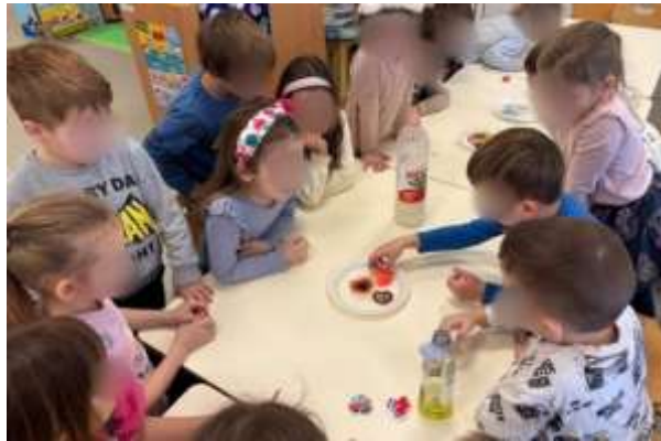
Slika 85. Eksperiment

interes djece za slovima i brojevima. Sva djeca se znaju sama potpisati čak i napisati nekoliko jednostavnih i kratkih riječi. Djeca pokazuju višu razinu pažnje i koncentracije te su ustrajni u obavljanju zadataka..