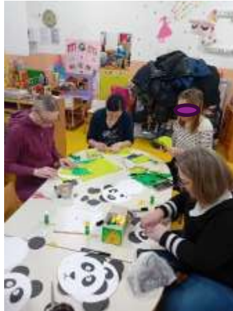
Slika 53. Radionica sa roditeljima povodom Maškara

Sudjelovanjem na Sajmu prikupili smo novac koji smo iskoristili za darivanje potrebite djece te za potrošni materijal u našoj skupini. Obiteljski dan realizirali smo tradicionalno nakon mise povodom Majčinog dana, a tada su djeca zajedno sa roditeljima izrađivala svoje obiteljsko stablo koje su odnijeli kući za uspomenu.