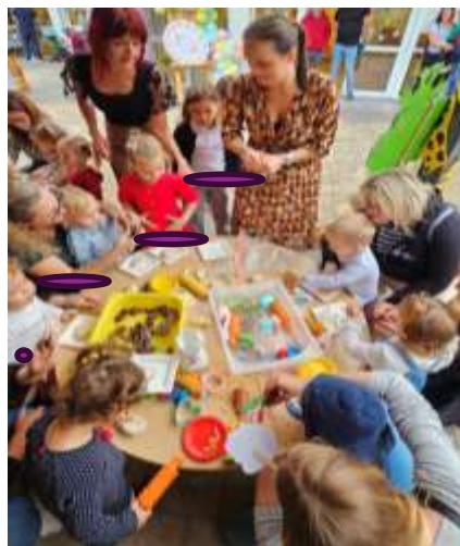
Slika 67. Jesenka svečanost

Jesenska svečanost održala se 10. Listopada u 16:00 h. Ostvarena je suradnja s roditeljima u vidu donošenja jesenskih plodova koji su bili potrebni za senzomotoričku aktivnost (kukuruz, tikvice, kesteni, žirevi, grančice). Zajednička aktivnost prolazi vrlo pozitivno, djeca uživaju u otrgivanju kukuruza s klipa te utiskivanju različitih jesenskih plodova u slano tijesto. Na druženju i u aktivnosti sudjelovala su i starija braća i sestre djece, što ih je još dodatno motiviralo.