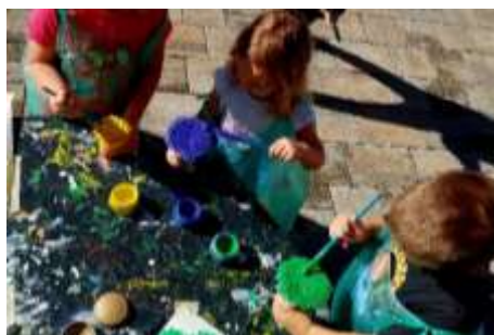
Slika 41. Likovna aktivnost s kistom

Dio djece još uvijek slabo barata škalicama, dvoje djece ima i poteškoća kod držanja olovke/žlice i samog baratanja, kao i korištenja kista. Trganje papira uvježbala su sva djeca. Tokom pedagoške godine vidljiv je pomak ka pozitivnome, doduše različitog intenziteta.