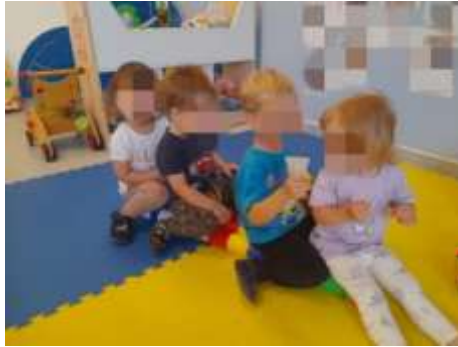
Slika 16. Simbolička igra – Putovanje brodom

Nastojale smo zadovoljiti emocionalne potrebe djece-osjećaj sigurnosti, zaštićenosti, pripadnosti, stvaranje pozitivnih odnosa unutar skupina, dobivanje priznanja i pohvala. Trudile smo se biti dobar model ponašanja, poticale djecu na suradnju, razvoj prijateljstva, poštovanje prema odraslima i među djecom. Kod mlađe djece interakcija se još uvijek bazira na razini odgajatelj – dijete, jako rijetko dijete – dijete. Odgajatelj ima veliku ulogu u interveniranju kod čekanja na red, dijeljenju igračkaka i sličnim situacijama.