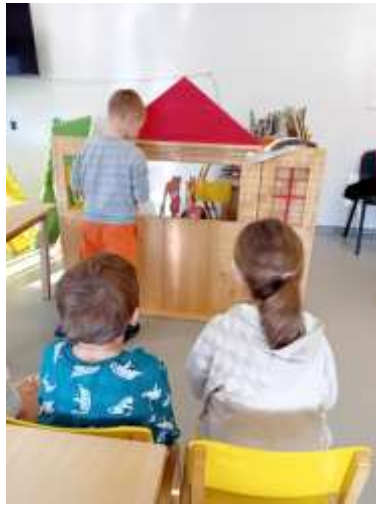
Slika 105. Scenska improvizacija plošnim lutkama

Autentičnost kroz likovnost, glazbu, jeziki održiv način življenja je osobito uočena kod nekoliko djece. S imperativom na svu djecu.