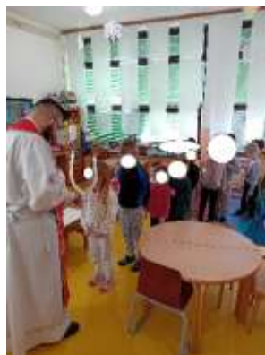
Slika 51. Blagoslov grla

Tijekom pedagoške godine njegujemo niz suradnji i to sa roditeljima, vanjskim ustanovama, na nivou našeg vrtića sa ostalim skupinama, sa stručnim timom, a takva vrsta uključenosti u rad sa djecom omogućava kvalitetniji prijenos informacija, postizanje novih znanja i uspjeha u bilo kojem području te učenje kroz iskustvo i istraživanje.