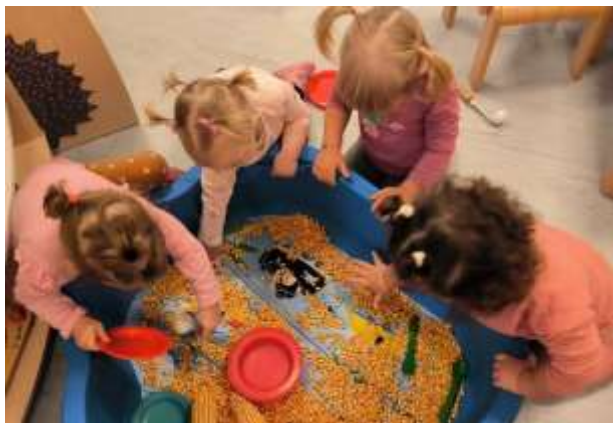
Slika 7. Punjenje, pražnjenje, presipavanje kukuruza

U ovoj dobi je važno osigurati aktivnosti u kojima dijete vidi rezultat svojeg djelovanja.