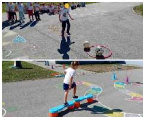
Slika 95. Poligon prepreka na dvorištu vrtića

Kao i svake godine, i ove godine je naš vrtić sudjelovao na Olimpijskom festivalu dječjih vrtića. Kao predškolska skupina intenzivno smo se motorički pripremali tokom cijele godine, te smo u ožujku napravili mjerenja po disciplinama (skok u dalj, trčanje 50m, štafeta, nogomet, bacanje loptice u dalj, rukomet) da bi mogli usporediti rezultate te odabrati najuspješniju djecu iz cijelog vrtića. Iz naše skupine sudjelovalo je 20 djece. Ostvarili su odlične rezultate, te smo u ukupnom poretku dječjih vrtića ostvarili 2. mjesto.