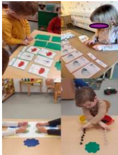
Slika 76. Montessori aktivnosti i Brain gym-A

Provedba Montessori elemenata u radu s djecom pozitivno je utjecala na spoznajni razvoj djece, potičući ih na aktivno učenje, samostalno promišljanje i razvijanje temeljnih kognitivnih vještina u skladu s njihovim razvojnim fazama.