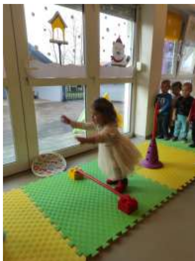
Slika 61. Vježbe na poligonu

Svakodnevne životno-praktične i radne aktivnosti pridonosile su usavršavanju njihovih sposobnosti za koordinaciju i preciznost kod baratanja predmetima. Oblačenje i svlačenje te obuvanje i izuvanje vježbamo svakodnevno prije odlaska na spavanje i prilikom buđenja. Potičemo djecu ohrabrivanjem da budu sigurna u sebe i da to mogu sami. Nošenje tanjura i šalica uz pažnju da se ne prolije, vučenje predmeta i igračaka uz usmjeravanje kojim će putem ići, razvrstavanje igračaka na predviđeno mjesto, slaganje predmeta u vis, otvaranje/zatvaranje, gužvanje i kidanje papira – neke su od aktivnosti pomoću kojih su djeca vježbala svoju koordinaciju i preciznost. Finu motoriku šake razvijali smo kroz crtanje, rezanje škaričama, lijepljenje, oblikovanje tijestom i rastresitim materijalima. Pokretljivost i gipkost vježbali smo kroz razne poligone koji su zahtijevali raznolike načine kretanja – prolaženje preko, između, ispod, kroz.