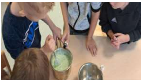
Slika 110. Izrada kreme od čuvarkuće

proksimalnog razvoja. Često se koristila metoda eksperimentiranja, osobito u području nežive prirode, potičući razvoj početnog razumijevanja prirodoslovnih pojmova.