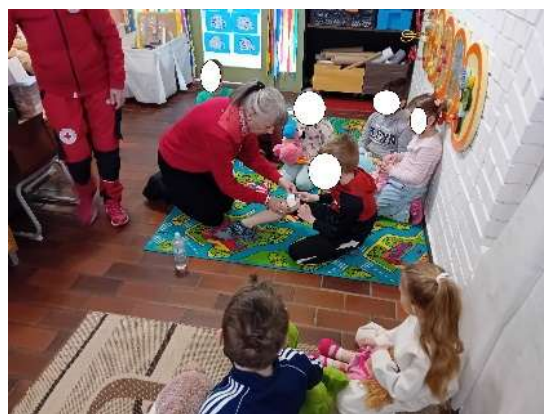
Slika 55. Učimo prvu pomoć za one koje volimo

Također naša ustanova surađuje sa jezičnim centrom „Didasko“ u sklopu čega je 14-ero djece polazilo program engleskog jezika koji se održavao jednom tjedno u našoj skupini. Ove godine u suradnji sa Crvenim križom Čakovec u našoj skupini održana je edukacija za predškolce „Učimo prvu pomoć za one koje volimo“, a za odgojitelje je održana edukacija „Hitna stanja i pružanje prve pomoći“ u multimedijalnoj dvorani muzeja grada Preloga“