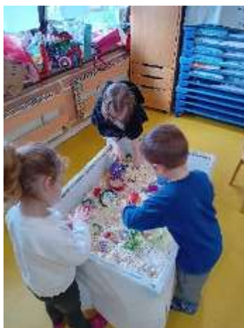
Slika 57. Istraživačka aktivnost sa kinetičkim pijeskom