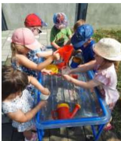
Slika 71. Igra vodom – međusobno uvažavanje i dogovaranje

Većina djece je tokom pedagoške godine razvila dovoljno kompetencija da bi se poželjno ponašala u odnosu prema sebi i drugima, u igri i u izvršavanju zaduženja. Kroz zajedničke aktivnosti i igru poticali smo razvoj suradništva, dogovaranje, prihvaćanje sugestija drugih. Svakodnevno smo djeci ukazivali na potrebu poštivanja tuđih prava, želja, potreba i isticali kompromis i dogovor. Nešto djeci i dalje nedostaje empatije i pozitivnih emocija prema drugima pa je to i dalje potrebno razvijati. Grube pokrete i ružne riječi pokušali smo zamijeniti poštovanjem i prihvaćanjem drugih. Pojedina djeca pokazuju pretjeranu emocionalnu osjetljivost koja rezultira plakanjem, žalošću, najčešće zbog straha od neuspjeha. Stoga je i dalje potrebno raditi na jačanju samopouzdanja i pozitivne slike o sebi. Ipak sva su djeca vesela, zadovoljna i vole ići u vrtić.