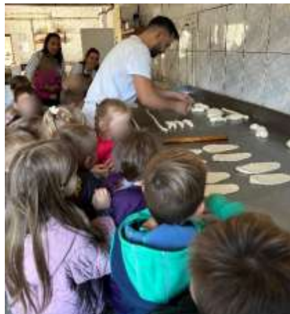
Slika 89. Posjet obiteljskoj pekari

Predavanje je održala psihologica a ujedno i majka djevojčice iz skupine na temu „Stilovi roditeljstva“. I ove godine roditelji su se odazvali radionici izrade kostima za fašničku povorku grada Preloga.