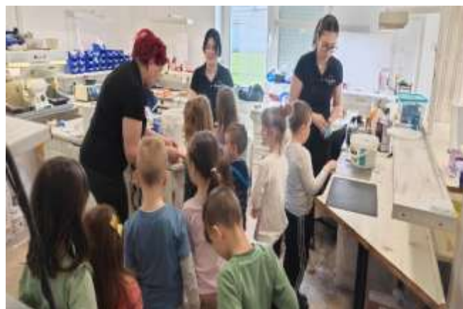
Slika 102. Posjeta ordinacije dentalne medicine

Izvešće sastavile odgojiteljice odgojno obrazovne skupine “Pandice”