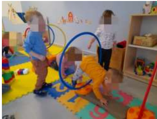
Slika 14. Tjelesna aktivnost – poligon prepreka

Djeca starija od 2,5 godina hodaju samouvjereno, zaobilaze prepreke u trku, hvataju i bacaju loptu, penju se samostalno ili uz malu asistenciju odgajatelja.