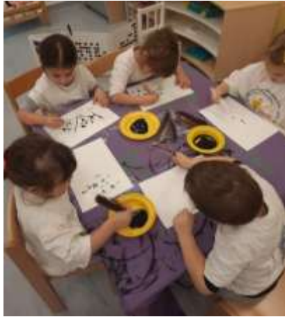
Slika 73. Likovna aktivnost slikanja i crtanja perom

izražavanje što smo postigli ponudom različitih materijala i likovnih tehnika. U scenskim igrama, igrama uloga, dramatizacijama do izražaja dolaze dječje glumačke sposobnosti. Svoju maštovitost pokazuju samostalno glumeći ili preko plošnih lutaka.