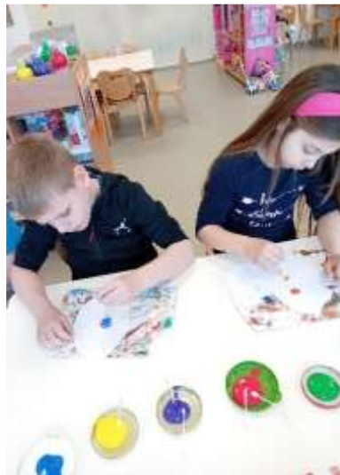
Slika 99. Slikanje temperom i vatenim štepićima

Priremama za različite svečanosti i druženja (planirane prema Godišnjem planu i programu Ustanove) djeca su uvježbavala dramske improvizacije (pamćenje teksta, izražajno govorenje) te razvijala sposobnost doživljavanja i izražavanja glazbe kao i glazbeno pamćenje (uvježbavanjem raznih plesnih koreografija i pjevanjem uz matricu te pjevanjem prema modelu).