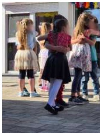
Slika 83. Razvoj empatije

Svakodnevno smo nastojale poticati pozitivnu atmosferu u skupini kako bi se sva djeca osjećala sigurno i ugodno. Ove pedagoške godine posebnu pažnju posvetile smo izražavanju emocija na društveno prihvatljiv način, poticanju empatije i uvažavanje drugih. Na početku pedagoške godine u suradnji s djecom dogovorena su pravila ponašanja. Kasnije zbog učestalih razmirica u igri kod djevojčica donijeli smo i neka nova pravila u igri te samim tim i spriječili učestale razmirice. Nekolicina djece traži pomoć odgojitelja u rješavanju problema. Tokom pedagoške godine vidljiva je sve veća suradnja djece u igri i zajedništvo. Nastojale smo djeci pružiti podršku i pohvalu kako bi razvila pozitivnu sliku o sebi.