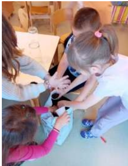
Slika 98. Sadnja začinskog bilja – životno praktična aktivnost