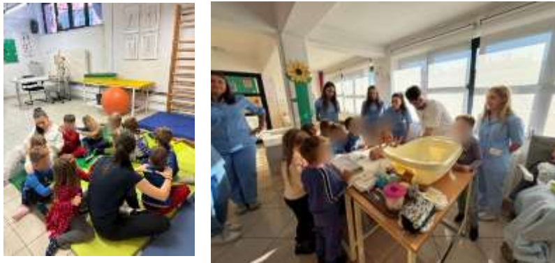
Slika 88. Posjet Maloj bolnici- suradnja s roditeljima

djeteta te njegovim interesima i potencijalima. Ove godine provele smo individualni razgovor sa svim roditeljima iz skupine. Uz planirane i realizirane svakodnevne aktivnosti djece, roditeljima smo nastojali pružiti informacije putem viber grupe „Medeki“. U suradnji s roditeljima organizirale smo dvije posjete u toku pedagoške godine te predavanje i radionicu na drugom roditeljskom sastanku