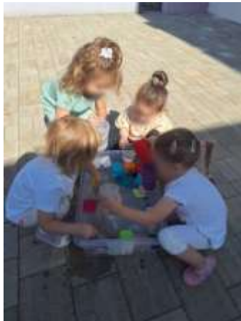
Slika 36. Životno-praktične aktivnosti

aktivnosti, kao i dobiti poticanja samostalnosti kod djece, prezentirane su roditeljima na tematskom roditeljskom sastanku.