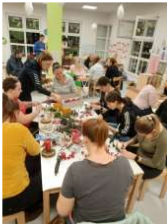
Slika 74. Božićna radionica sa roditeljima

Ove pedagoške godine planirali smo i održali tri roditeljska sastanka. Sa roditeljima smo komunicirale svakodnevno prilikom dolaska i odlaska djece iz vrtića dajući kratke informacije o boravku djece. Obavještavale smo ih o svemu važnome kroz viber grupu. Tijekom pedagoške godine većina roditelja odazvala se individualnim razgovorima kada smo procijenili da su neophodni ili na zahtjev roditelja. Sadržaji tih razgovora bili su vezani uz zdravstvene prilike i navike djece, ponašanja djece u skupini.