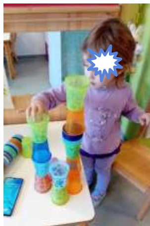
Slika 43. Građenje tornjem

Sva djece nižu u red kockice ili čaše, nekolicina je vrlo spretna u nizanju u visinu, „toranj“, građenje sa križnim spajanjem, gađanje i rušenje tornja, bacanje lopte preko prepreke, dodavanje, a pojedinci grade neke građevine i konstruiraju maštovita vozila.