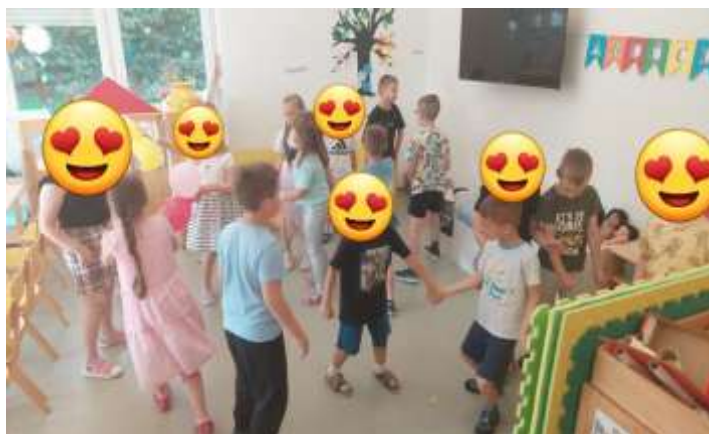
Slika 104. Slika 3. Ples u paru/manjoj grupi djece

Individualnim pristupom, uključivanjem odgajatelja kao suigrača nastojale smo poticati djecu na međusobnu zajedničku ili samostalnu igru.