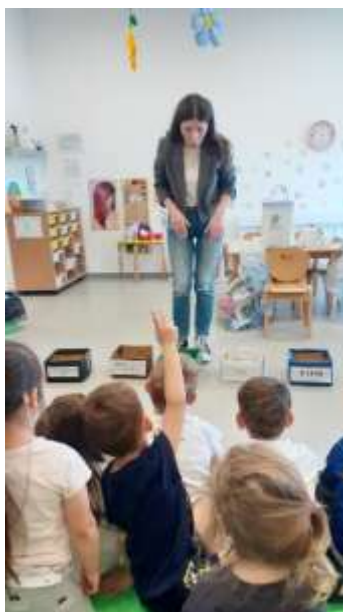
Slika 79. Edukacija sortiranja smeća

U prosincu je, u sklopu Nacionalnog projekta, organizirana Večer matematike. Osmišljena je na način da su djeca, u pratnji svojih roditelja, mogla slobodno cirkulirati po sobama u kojima su bili ponuđeni poticaji s područja matematičkih zadataka, te odabrati aktivnosti u kojima će sudjelovati, osobito u onima koje su bile primjerene kronološkom i razvojnom statusu djeteta. Kao i svake godine, i ove godine surađivali smo i s Knjižnicom i čitaonicom grada Preloga kao i s tvrtkom Pre-kom, kroz edukativnu radionicu u svrhu zbrinjavanja i sortiranja otpada.