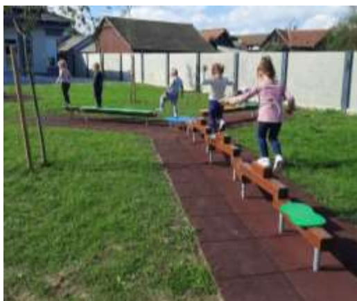
Slika 70. Tjelesna aktivnost na dvorištu vrtića