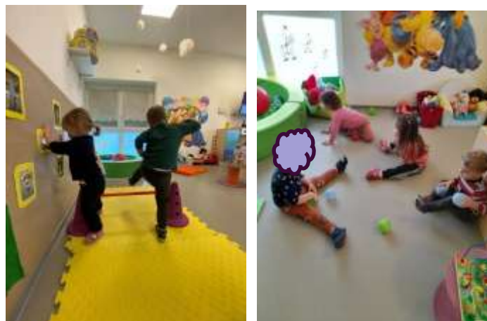
Slika 23. Motoričke aktivnosti u skupini

Od početka pedagoške godine djeci usadujemo osnovne higijenske navike (pranje ruku, umivanje, higijena djece), starija djeca brišu nosić i bacaju maramice u koš, samostalno jedu i počinju gotovo svi piti iz čašica, većina djece svladala je izuvanje papučica prilikom odlaska na dnevni odmor i petero djece se uspješno obuva nakon odmora, polovica djece uspješno skida čarapice i hlačice. Pozitivan napredak vidljiv je i kod pospremanja igračkaka nakon igre i aktivnosti po centrima sobe dnevnog boravka.