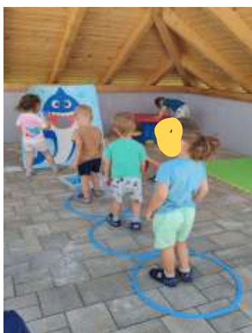
Slika 62. Poligon na otvorenom

Svakodnevne životno-praktične i radne aktivnosti pridonosile su usavršavanju njihovih sposobnosti za koordinaciju i preciznost kod baratanja predmetima. Oblačenje i svlačenje te obuvanje i izuvanje vježbamo svakodnevno prije odlaska na spavanje i prilikom buđenja. Potičemo djecu ohrabrivanjem da budu sigurna u sebe i da to mogu sami. Nošenje tanjura i šalica uz pažnju da se ne prolije, vučenje predmeta i igračaka uz usmjeravanje kojim će putem ići, razvrstavanje igračaka na predviđeno mjesto, slaganje predmeta u vis, otvaranje/zatvaranje, gužvanje i kidanje papira – neke su od aktivnosti pomoću kojih su djeca vježbala svoju koordinaciju i preciznost. Finu motoriku šake razvijali smo kroz crtanje, rezanje škaričama, lijepljenje, oblikovanje tijestom i rastresitim materijalima. Pokretljivost i gipkost vježbali smo kroz razne poligone koji su zahtijevali raznolike načine kretanja – prolaženje preko, između, ispod, kroz.