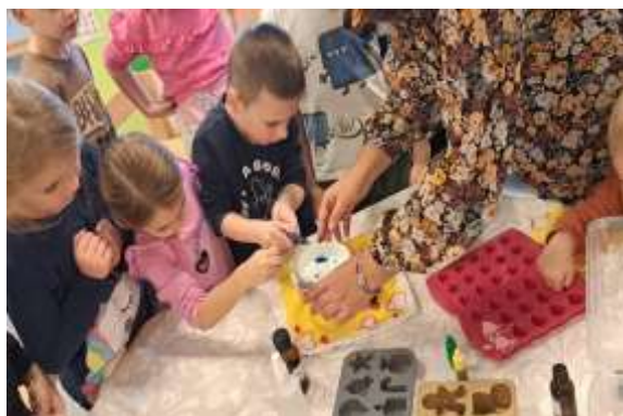
Slika 114. Slika 10. Suradnja s bakom (izrada sapuna)

Suradjujući s užom i širom zajednicom, djeca su stekla široku lepezu poticaja, iskustva i spoznaja te su razvila afirmativni identitet i osnažena za aktivno uključivanje i sudjelovanje u kulturnom i društvenom životu zajednice.