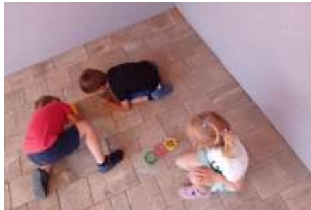
Slika 45. Istraživanje kukaca

Kako je pedagoška godina odmicala, primjećuje se da sve više djece samostalno inicirala i organizirala jednostavne aktivnosti (npr. igra u šatoru, s vozilima, u centru kuhinje, građevnom centru i sl.). Okupljali su se naizmjenično prema vlastitom interesu. Pažnja traje sve duže i tokom godine se trajanje pažnje vidljivo produžuje.