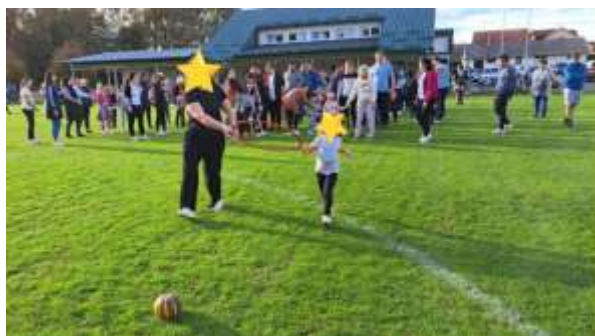
Slika 10. Jesenska svečanost - natjecateljska igra