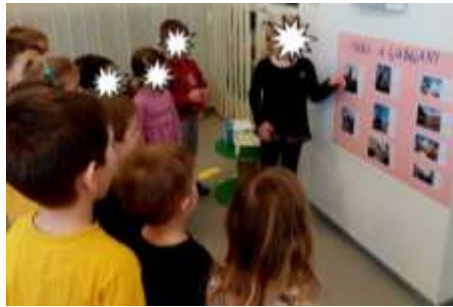
Slika 47. Prepričavanje doživljaja nakon obiteljskog putovanja

Dobro razvijen vokabular imaju djeca u četvrtoj i petoj godini života, osim dvojice dječaka sa teškoćama u razvoju i jedne djevojčice. Dječaci razumiju, ali izgovor nije razvijen ili je slabo razvijen. Tokom cijele godine odgojiteljice su poticale djecu da se međusobno dogovaraju, riječima izražavaju svoje potrebe, postavljaju se jasna pitanja i traže, te čekaju odgovori. Troje djece je nakon obiteljskog putovanja imalo verbalnu prezentaciju uz plakat sa sličicama.