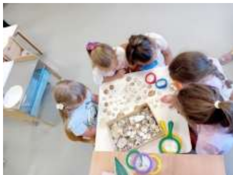
Slika 86. Istraživačka aktivnost školjkama

Kroz svakodnevne aktivnosti nastojale smo djeci omogućiti poticajno okruženje koje ih je navelo na istraživanje, podržavanje senzornog kapaciteta, upoznavanje biljnog i životinjskog svijeta te prostornu orijentaciju.