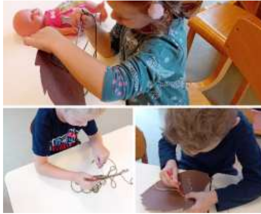
Slika 97. Šivanje vune na karton

Imajući na umu da djeca uče čineći nastojale smo im nuditi što više aktivnosti kroz koje mogu samostalno istraživati, promatrati i stjecati nova znanja o predmetima i okolini.