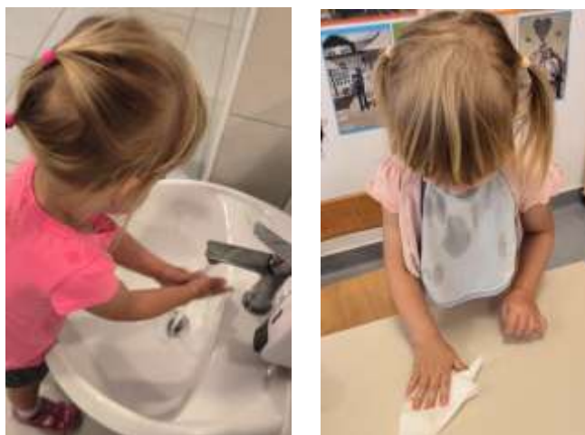
Slika 3. Poticanje samostalnosti

U jaslicama se svakodnevno potiče usavršavanje svih oblika prirodnog kretanja te razvoj cjelokupne motorike tijela. Posebice jebilo izazovno poticanje penjanja i spuštanja sa tobogana što je uvijek bilo uz nadzor odgojiteljice. Djeca su se isprva često penjala po strani na kojoj se spušta, bila nestrpljiva kada su čekala na red ili se gurala. Kroz igru smo poticali usavršavanje dohvata i baratanje predmetima i igračkama (gradnja tornja od kockica, ubacivanje predmeta u otvor, listanje slikovnice). Djeca su često i sama slagala poligon od strunjača, tunela za provlačenje, spužvastih elemenata, obruča. Za razvoj fine motorike šake i prstiju nudile smo pregršt aktivnosti kroz igru i zabavu, a omiljena aktivnost je bila punjenje, pražnjenje, presipavanje rasipnog materijala. Od samog početka prakticirali smo svakodnevni odlazak u šetnju ukoliko su nam vremenske prilike dozvoljavale, pritom su djeca stjecala naviku pridržavanja za uže. Djeca su svakodnevno poticana na hodanje, puzanje, provlačenje, penjanje, silaženje, skakanje različitim aktivnostima za osvajanje ravnoteže i koordinacije. Poticali smo na samostalnost kod služenja priborom za jelo (žlica), držanje i šaranje olovkom što je predstavljalo poseban izazov posebno mlađoj djeci. Napredak je vidljiv i u samostalnosti, starija djeca mogu sama oprati ruke, umiti lice, obrisati nos, izuti papuče.