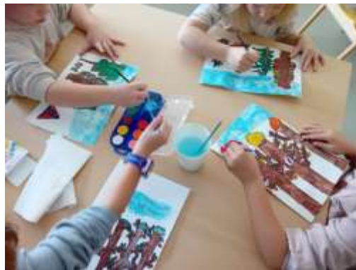
Slika 106. Kombinacija likovnih tehnika flomaster i vodene boje; tema: „Izlet u šumu“