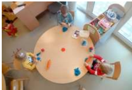
Slika 42. Modeliranje plastelinom

Zanimljive aktivnosti djeci bile su aktivnosti sa obojanom rižom, kukuruzom, palentom, domaćim plastelinom, tijestom i vodom i pijeskom. Djeca mogu koristiti različite posudice, ljevčiče, žlica različitih veličina za punjenje, pražnjenje, različite valjčiče, kalupe za utiskivanje, odvrtanje poklopaca, različite kapaljke, epruvete i sl. Tim aktivnostima potiče se razvoj fine motorike djece koja je vrlo važna za razvoj grafomotorike. Dio djece, koja su u petoj godini života i djevojčica s napunjenih 3 i pol godina, precrtava geometrijske likove, a i pojedine druge likove po šabloni i crta čovjeka sa osnovnim dijelovima tijela.