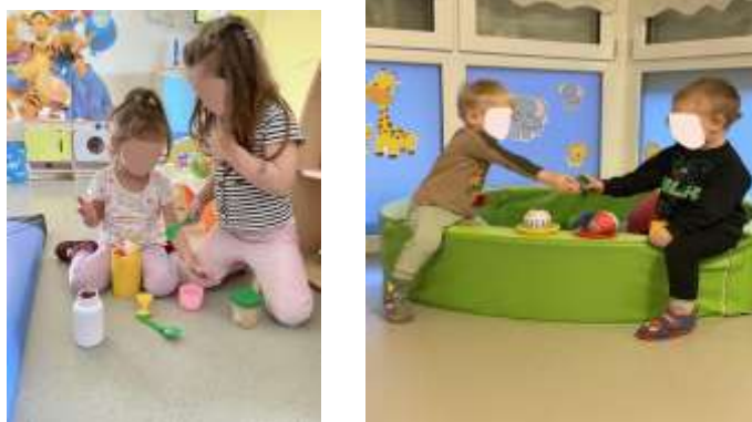
Slika 28. Simbolička igra