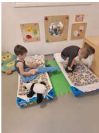
Slika 35. Poticanje samostalnosti

Djeca iz skupine u fazi su intenzivnog razvoja pojma o sebi i o drugima, a ponajviše o svojim emocijama. Razdoblje je obilježeno značajnim promjenama u ponašanju te međusobnim odnosima. Već početkom listopada uočena je sve veća želja i potreba djece za samostalnošću, stoga smo nastojali češće provoditi radno – praktične aktivnosti u svrhu razvoja poželjnih navika, samostalnosti, odgovornosti, samopouzdanja te razvoja motoričkih i kognitivnih vještina.