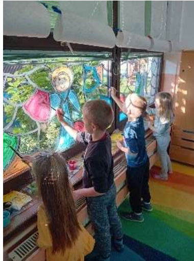
Slika 58. slikanje na staklu-izrada vitraja

Izvešće izradile odgojiteljice skupine „Vrapčići“