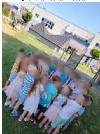
Slika 84. Zajedništvo