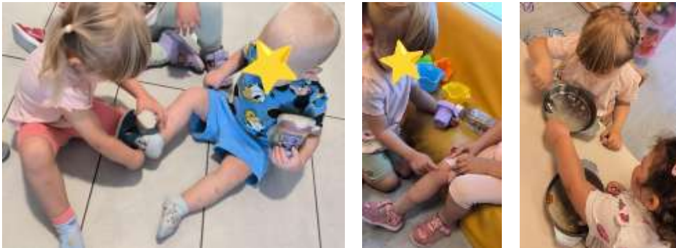
Slika 5. Primjer pomaganja drugom djetetu

šetnji, pri obuvanju ili se međusobno tješiti kada je netko pokazivao emociju tuge. Jedna djevojčica je trebala podršku prilikom uključivanja u interakciju s drugom djecom. Zbog svoje sramežljive i mirne naravi, često bi se u početku igrala sama. Odgojiteljice su tome doskočile poticanjem razvoja samopouzdanja, uključivanjem djevojčice u grupne aktivnosti. Pravilnim modelom uključivala se u igru te uspostavila pozitivnu interakciju s drugom djecom. Kod većine djece uočeno je zadovoljstvo na licu, znajući da su razvili osjećaj vlastite sposobnosti, kada su pohvaljeni zbog samostalno ovladane određene vještine (npr. pospremanje igraćaka, izuvanje/obuvanje papuča i sl.).