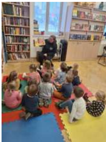
Slika 39. Prvi posjet knjižnici

Posebnu pažnju posvetili smo zajedničkim druženjima – Jesenska svečanost provedena je u opuštenoj i pozitivnoj atmosferi, a Dan obitelji bio je prilika da kroz igru i kreativnost zajedno istaknemo važnost obitelji i zajednice. Također, povodom maškara organizirana je tematska radionica na kojoj su roditelji i odgojitelji zajedno izrađivali kostime, a zatim se svi zajedno uključili u maskiranu povorku u organizaciji Grada Preloga. Nadalje, u sklopu poticanja rane pismenosti i razvoja interesa prema čitanju, ostvarili smo suradnju s Knjižnicom i čitaonicom grada Preloga.