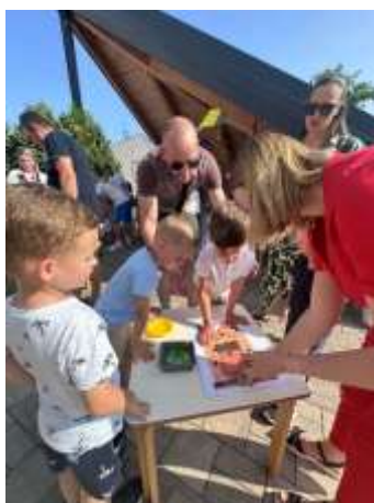
Slika 80. suradnja i druženje s roditeljima povodom Obiteljskog dana

U prosincu je, u sklopu Nacionalnog projekta, organizirana Večer matematike. Osmišljena je na način da su djeca, u pratnji svojih roditelja, mogla slobodno cirkulirati po sobama u kojima su bili ponuđeni poticaji s područja matematičkih zadataka, te odabrati aktivnosti u kojima će sudjelovati, osobito u onima koje su bile primjerene kronološkom i razvojnom statusu djeteta. Kao i svake godine, i ove godine surađivali smo i s Knjižnicom i čitaonicom grada Preloga kao i s tvrtkom Pre-kom, kroz edukativnu radionicu u svrhu zbrinjavanja i sortiranja otpada.