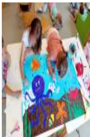
Slika 93. Zajednička likovna aktivnost