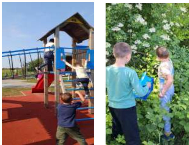
Slika 107. Aktivnosti na otvorenom