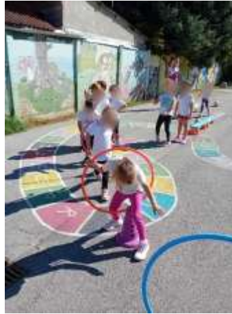
Slika 81. Poligon prepreka

igre. Pojedine djevojčice iskazuju veliki interes za ples koji im omogućuje izražavanje emocija kroz pokret. Osobitu pažnju posvetile smo razvoju fine motorike – mišićnih skupina šake i prstiju te okulomotorne koordinacije.