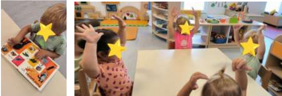
Slika 8. Listanje slikovnice i prstovno - gestovna igra

Djevojčice pokazuju interes za izražavanje glazbom i pokretom. Kod jedne djevojčice je posebno naglašena usklađenost pokreta i glazbe, stoga joj je trebalo nuditi adekvatne aktivnosti iz ovog područja. Odgojitelji svakodnevno pozitivno utječu na pravilan razvoj dječjeg govora, pravilan izgovor pojedinih glasova, nastoje bogatiti vokabular djece kroz svakodnevne razgovore, pričanjem i prepričavanjem priča. Djecu se potiče na verbalno izražavanje.