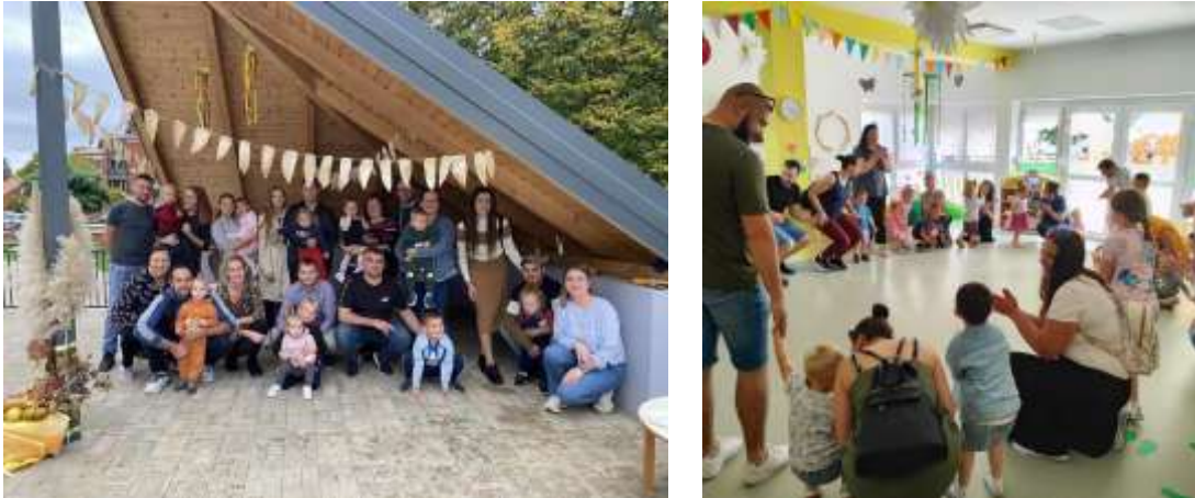
Slika 30. Druženja s roditeljima

Na proljeće je održano Obiteljsko druženje, gdje su roditeljima kroz kratku prezentaciju rada prikazane naučene pjesmice, prstovne igre te pjesme uz glazbu i pokret. Djeca su s veseljem pokazala stečena znanja, a roditelji su iskazali veliko zadovoljstvo i ponos.