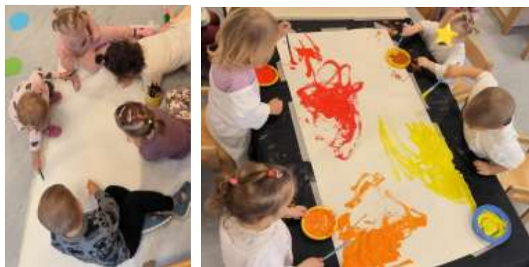
Slika 2. Zajednička likovna aktivnost