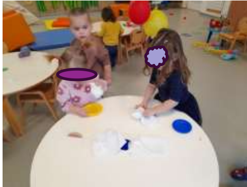
Slika 24. Životno-praktične i radne aktivnosti

Dijete uči čineći, kroz igru. Vođene time kroz igru smo nastojale tijekom cijele pedagoške godine raznim aktivnostima poticati i razvijati aktivno sudjelovanje djece uz istraživačke aktivnosti, samostalno promatranje, manipulaciju predmetima, istraživanje okoline, spoznaju, poticanje sposobnosti klasifikacije i serijacije kod djece, pri spremanju igračaka po sobi.