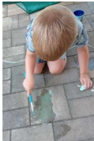
Slika 48. Likovno-kreativni izričaj- kreda u kombinaciji s vodom

Likovni centar stalno je dostupan djece. Svakodnevno je dostupno korištenje drvenih olovaka, bojica, flomastera, a ostala likovna sredstva i materijale nudimo u grupnim ili individualnim aktivnostima. Djeca vole aktivnosti s temperom bojom i sa škalicama. Aktivnosti s domaćim plastelinom ih zaokupe i dolazi do izražaja da se stvaralaštvo uvelike isprepliće sa maštom kod djece koja su napunila četiri godine. Dječak sa Down sindromom sve više prihvaća likovne aktivnosti. Promatra ponuđeni papir ponekad gužva, sve češće prihvaća flomastera ponekad i kist. Plastelin i dalje odbija dirati. Dječak sa teškoćama iz spektra autizma površno i vrlo kratko sudjeluje u likovno-kreativnim aktivnostima.