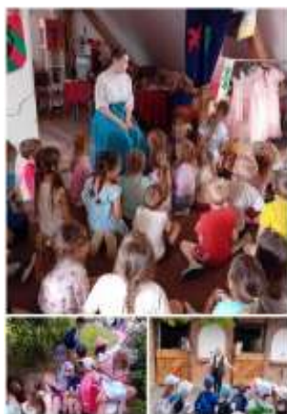
Slika 90. Izlet na posjed Contessa