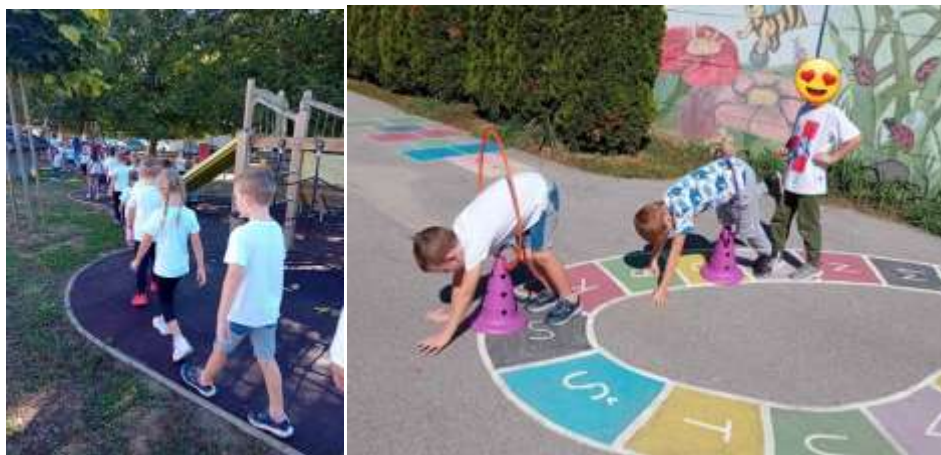
Slika 103. Obilježavanje Hrvatskog Olimpijskog dana u vrtiću

Uvođenjem zdrave prehrane (HealtyMeal), djeca se hrane prema nutricionističkim standardima.