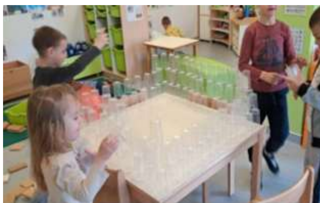
Slika 109. Suradnja i zajedništvo

Kroz godinu su se djeca sve sigurnije izražavala, pokazivala veću razinu suradnje, empatije i samopoštovanja. Socijalna kompetentnost značajno je napredovala, a s njom i osjećaj zajedništva, međusobna povezanost i prijateljstvo unutar skupine.