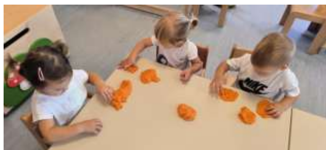
Slika 9. Modeliranje domaćim plastelinom

Osim govornog izražavanja pratile smo i poticale i druge oblike izražavanja. U jutarnjim satima, a ponekad i prema procijeni odgojitelja, djeci puštamo klasičnu glazbu poznatih skladatelja i instrumentalnu glazbu za opuštanje. Djeci je svakodnevno dostupan glazbeni centar, u kojem mogu birati zveckice, šuškalice, udaraljke, ksilofon i stvarati svoje zvukove te istraživati. Puštanjem glazbe (instrumentalne, vesele dječje pjesmice) poticali smo smirenost i radost, pamćenje, osjećaj za ritam te razvoj motorike kroz ples. Likovni centar stalno je dostupan djeci. Svakodnevno je dostupno korištenje drvenih olovaka, bojica, flomastera, pastela, a ostala likovna sredstva i materijale nudimo u grupnim ili individualnim aktivnostima. Djeca najviše vole slikati temperama te modeliranje plastelinom, tijestom.