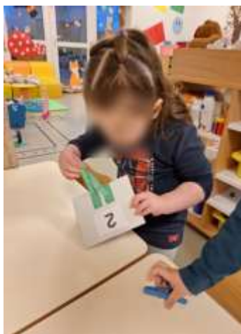
Slika 37. Predmatematička aktivnost

Spoznajni razvoj poticali smo i kroz predmatematičke aktivnosti razvrstavanja i klasificiranja čepova i pompona u boji, gumbića raznih veličina, orijentacijom u prostoru, prebrojavanjem kuglica i nizanjem perlica prema zadanom broju. Provedene aktivnosti nisu služile samo za usvajanje matematike, nego i za razvoj kognitivnih funkcija poput pažnje i pamćenja.