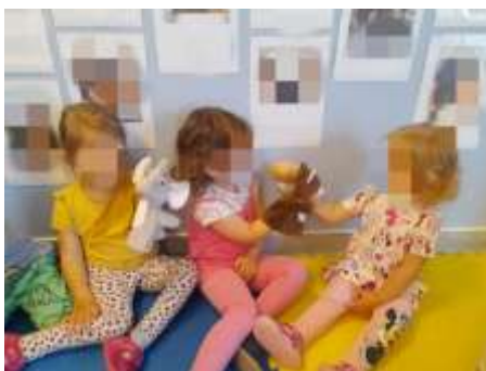
Slika 19. Dramatizacija ginjola lutkama