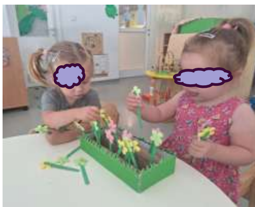
Slika 26. Igra umetaljkama

Djeca rado i s veseljem pristupaju razvrstavanju kockica u građevnom centru, gdje odvajamo spužvaste, gumene, velike plastične i lego-duplo kockice. Vrlo su ponosni na svoja postignuća sortiranja. Različite slikovnice pomogle su djeci da povežu značenje određenog teksta, slike, pažnju i koncentraciju, te stječu nove spoznaje putem vizualnih i slušnih doživljaja. Kroz godinu nudile smo im i razne umetaljke, premetaljke, puzzle, slagalice i male mozgalice u sastavljanju dijelova životinja, što s velikim interesom pronalaze i sastavljaju.