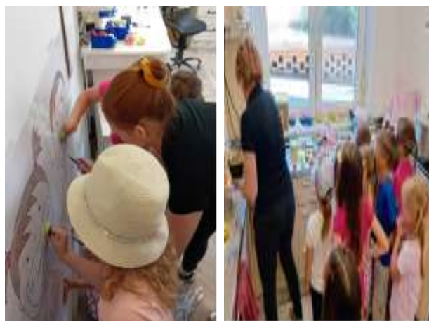
Slika 94. Posjet zubnoj ordinaciji- suradnja s roditeljima

U vrtiću smo održali Jesensku svečanost, Dan obitelji, Dane kruha u vrtiću, Večer matematike, sudjelovali smo na Božićnoj priredbi i Sajmu cvijeća.