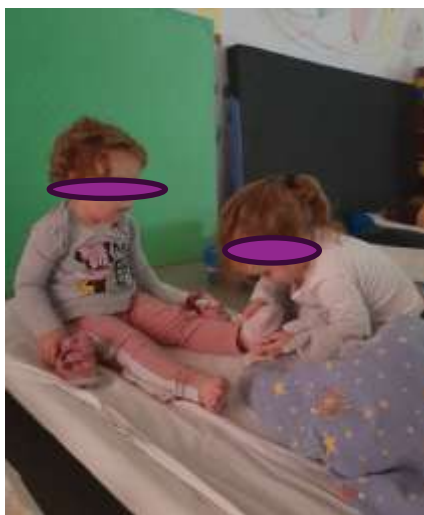
Slika 63. Empatija i spremnost na pomoć

Poticali smo ujedno i nenasilnu komunikaciju i spremnost na suradnju. Djeca u kolektivu moraju biti spremna podijeliti igračke, čekati na red te paziti na prijatelje. Empatija je još jedna vještina koju smo njegovali svakog dana.