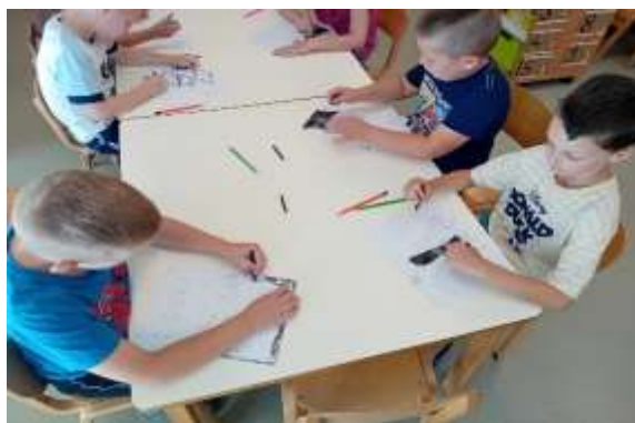
Slika 100. Upoznavanje nove crtačke tehnike – ugljen