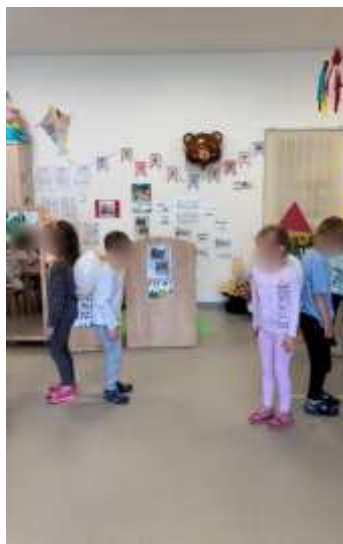
Slika 82. Natjecateljska igra balonom

Kod pojedine djece smo uočile odstupanje u aktivnostima u kojima nepravilno drže olovku ili drugi likovni pribor ili otežano režu škarama. Organiziranjem različitih aktivnosti nastojale smo potaknuti djecu na uvježbavanje i usavršavanje tih vještina. U suradnji s zdravstvenom voditeljicom provedena su antropometrijska mjerenja početkom i krajem pedagoške godine.