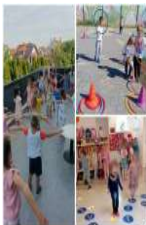
Slika 91.Slika 2. Tjelesne aktivnosti

Kod većine djece tjelesni i psihomotorni razvoj tekao je u skladu s predviđenim razvojem za njihovu kronološku dob. Jedino kod dvije djevojčice i jednog dječaka primjećujemo određenu nesigurnost i nespretnost kod obavljanja vježbi i aktivnosti, ali kroz ohrabrivanje i poticanje na izvršavanje tih radnji i oni su ih usavršili (trčanje, hodanje po suženim površinama, skakanje na jednoj nozi). Svakodnevno smo nastojale zadovoljiti djetetovu potrebu za kretanjem. Djeca su koristila prostor sobe dnevnog boravka, hodnika vrtića i vanjske prostore - dvorište i igre na asfaltu, ili smo odlazili u šetnju okolicom vrtića. Poticale smo dječju spontanu inicijativu, ali smo i osmišljavale aktivnosti koje uključuju osnovne i specifične vrste kretanja.