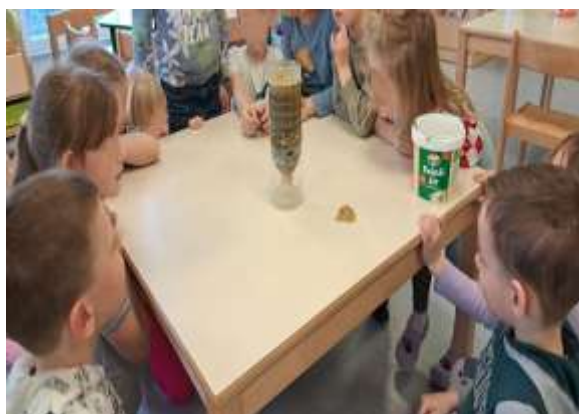
Slika 111. Filtriranje vode

Kod predškolske djece aktivnosti su dodatno bile usmjerene na razvoj pažnje, fine motorike, predčitačkih i predmatematičkih vještina te usvajanje prostornih i vremenskih odnosa. Fokus je bio i na osobnoj spoznaji te razumijevanju obiteljskih odnosa.