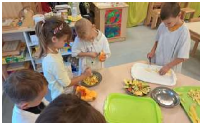
Slika 108. Priprema juhe od bundeve

Kroz godinu su se djeca sve sigurnije izražavala, pokazivala veću razinu suradnje, empatije i samopoštovanja. Socijalna kompetentnost značajno je napredovala, a s njom i osjećaj zajedništva, međusobna povezanost i prijateljstvo unutar skupine.