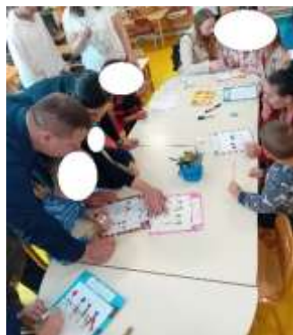
Slika 52. Obilježavanje Obiteljskog dana te izrada obiteljske slike djece i roditelja