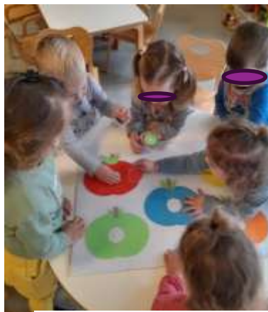
Slika 59. Umetaljka- boje

Organizacijski i materijalni uvjeti za ostvarivanje zadaća odnose se na osiguravanje prostornih i resursnih uvjeta potrebnih za uspješno izvršavanje određenih zadataka u odgojno-obrazovnom radu. U našoj sobi dnevnog boravka, nalaze se građevinski centar, stolno – manipulativni centar, centar obitelji, centar kuhinje, centar liječnika, interaktivni centar „Pekarčića“ te kutak početnog čitanja i pisanja.