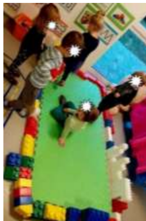
Slika 44. Igra u manjim grupama

Održava se pozitivna emocionalna atmosfera. Svakodnevno se u skupini poticalo na stvaranje toplog prijateljskog okruženja u aktivnostima, poticalo se na pozitivne vršnjačke odnose među djecom, razvoju empatije i tolerancije. Posebna pažnja se posvetila razvoju samostalnosti djeteta ponaosob, njegove kompetencije u svim radnjama koje može obaviti, te razvoju pozitivne slike o sebi i svojim mogućnostima (sve u skladu s djetetovom kronološkom dobi i razvojnim sposobnostima, s obzirom da se radi o mješovitoj vrtičkoj skupini).