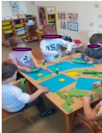
Slika 77. Likovno istraživanje, izražavanje, i stvaranje

(s naglaskom na glazbu, likovnost i jezik), implementacija programa prema koncepciji Marije Montessori; upoznati djecu s likovnom umjetnošću i likovnim tehnikama primjerenim njihovom uzrastu, kultivirati njihov odnos prema likovnim vrijednostima i razvijati osjećaj za estetski lijepo, razvijati likovnu i opću kreativnost, poticati i razvijati dječje stvaralaštvo (u kojem nije toliko naglasak na konačni produkt već na sam proces nastajanja) te u konačnici razvijati kod djeteta sposobnosti koje će predstavljati uvod i osnovu za svaki rad i proizvodnju, biti mu pomoć u budućem poslu, zanimanju i prilagodbi na nove uvjete života, rasta i razvoja. Tijekom pedagoške godine djeca su pokazala napredak u području verbalne i neverbalne komunikacije, te su kroz svakodnevne aktivnosti razvijala svoje jezične, izražajne i stvaralačke sposobnosti. Verbalna komunikacija - djeca su uspješno koristila složene rečenice, postavljala pitanja i izražavala svoje želje, potrebe i mišljenja.