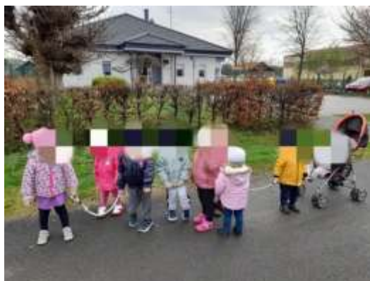
Slika 11. Boravak na zraku

Prostor sobe dnevnog boravka strukturirale smo tako da djeca imaju slobodu kretanja i sudjelovanja u različitim aktivnostima. Trudile smo se omogućiti djeci slobodan izbor aktivnosti prema vlastitim interesima i razvojnim potrebama, uz poticanje samostalnosti i kreativnosti, osigurati im dovoljne količine vremena za igru i aktivnosti, kako bi djeca mogla istraživati i učiti vlastitim tempom, biti im podrška, poticati njihovu znatiželju i kreativnost te osigurati sigurno i poticajno okruženje. Sve planirane aktivnosti većinom smo provodili u sobi dnevnog boravka, no kada su nam vremenske prilike to dopuštale, maksimalno smo iskoristili vrijeme za šetnje okolicom vrtića ili pak poljem.