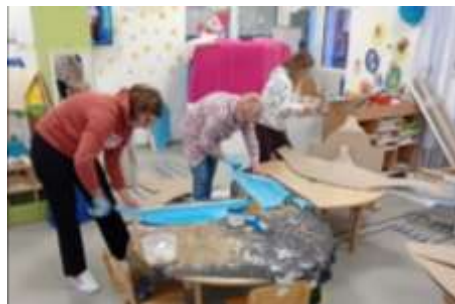
Slika 40. Radionica za maškare

Krajem pedagoške godine posjetili smo OPG Pintarić, gdje su djeca stekla novo spoznajno i životno-praktično iskustvo. Za kraj posjete prikladno su počastili svu djecu.