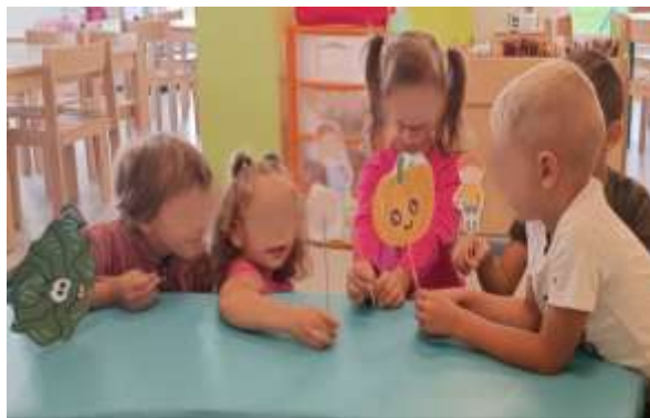
Slika 112. Lutkarska predstava

Uočeni napredak tijekom godine bio je znatan — djeca su postala opuštenija, sigurnija u vlastiti izričaj, češće se izražavaju spontano i s više kreativnosti, čime se postupno razvijalo i njihovo stvaralačko jezično umijeće.