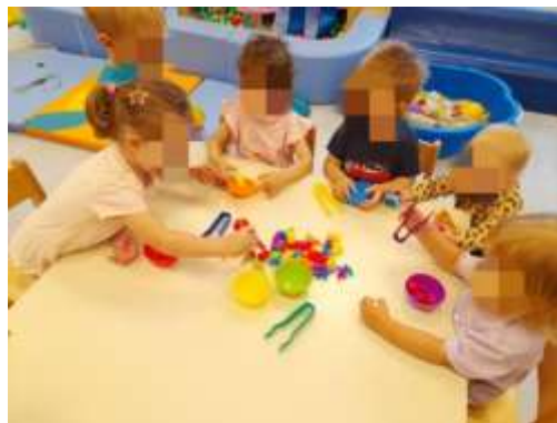
Slika 15. Aktivnost za razvoj fine motorike – uparivanje