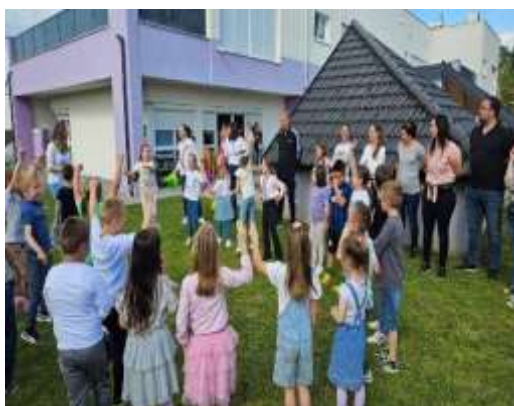
Slika 101. Zajednička igra roditelja i djece – Obiteljsko druženje

Održana su 2 druženja djece i roditelja (Obiteljsko i Jesensko druženje), 4 roditeljska sastanka, radionica za roditelje (povodom Maškara) te Završna svečanost naše skupine. Individualni razgovori održavali su se prema potrebama roditelja ili na zahtjev odgajatelja tokom cijele predagoške godine.