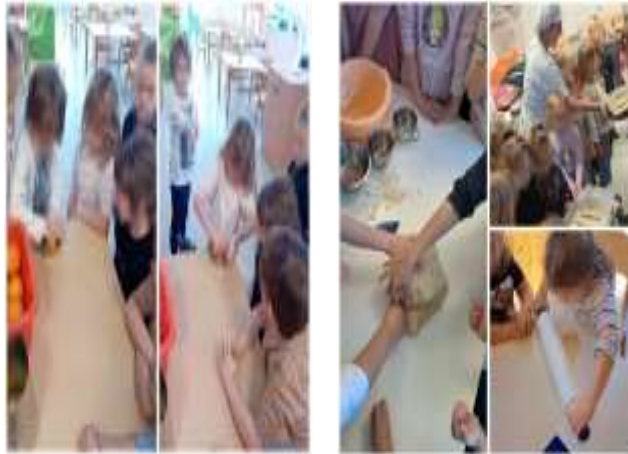
Slika 92. Istraživačke aktivnosti

Sve češće smo igrali razne igre za poticanje predčitalačkih vještina. Većina djece već prepoznaje početni glas u riječi, nekolicina i posljednji u kratkim riječima. Polako rastavljamo riječi na slogove. Nekolicina djece zna i svoju adresu i kućni broj. Kod nekolicine djece potrebno je poticati produljivanje pažnje, koncentracije, ustrajnosti i upornosti te završavanje aktivnosti.