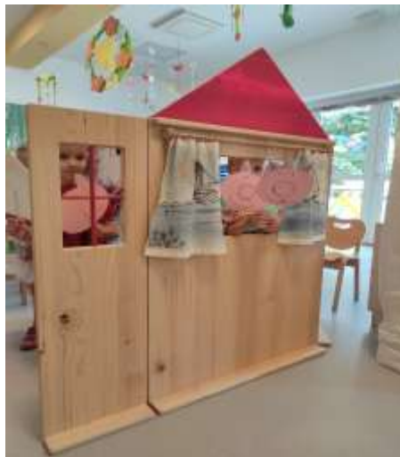
Slika 65. Kratke dramatizacije

Slikovnice, priče i dramatizacije bile su naš prijatelj u prenošenju važnih poruka. Ove godine uveli smo poznate bajke kao što su „Crvenkapica“, „Tri prašćića“, „Vuk i sedam kozlića“, „Mala sirena“, „Vrlo gladna gusjenica“ i još mnoge druge. Uz same slikovnice, počeli smo i s dramatizacijom priča. Priče su bile pokretne, iskakali smo iz lika u lik te koristili svoj govor i tijelo u prepričavanju priča. Djeca su objeručke prihvatila dramatiziranje te ubrzo i sami počeli ulaziti u odabrane likove. Koristimo paravane, lutke i ručno izrađene aplikacije za što atraktivnije priče.