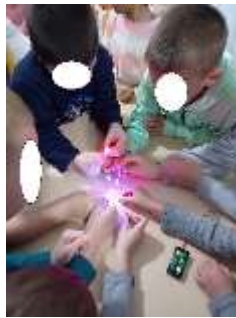
Slika 54. Sudjelovanje na festivalu znanosti

te se upoznali sa učiteljem i sa prostorom škole. Također sa Osnovnom školom obilježavamo Hrvatski olimpijski dan te zajedno provodimo tjelesne aktivnosti u našem dvorištu. Mjesni odbor Cirkovljan ove godine nas je pozvao na sudjelovanje u manifestaciji „Proljeće u Cirkovljanu“ koja se održala u travnju te smo se tom prilikom predstavili plesnom koreografijom i igrokazom.