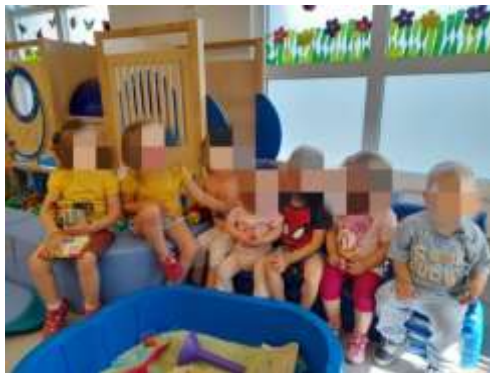
Slika 12. Mišeki za vrijeme jutarnjeg okupljanja

Kroz cijelu pedagošku godinu sa susjednom skupinom „Lavići“ razmjenjivali smo igračke i ostalu didaktiku, nadopunjavali centre novim neoblikovanim materijalima i time omogućile djeci konstantnu raznolikost što je potaknulo veći interes za pojedine igre i aktivnosti.