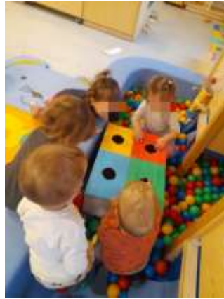
Slika 18. Grupacija boja

djeca pokazala su velik interes za igre u kojima istražuju – punjenjem, pražnjenjem posudica, presipavanjem,...- igra obojena riža, igra kinetičkim pijeskom, bazen sa lopticama u boji – u tim istraživačkim aktivnostima su se zadržavali veoma dugo. Kod spoznajnog razvoja često smo poticale razlikovanje i imenovanje osnovnih boja, te prepoznavanje ostalih kroz razne igre i brojalica.