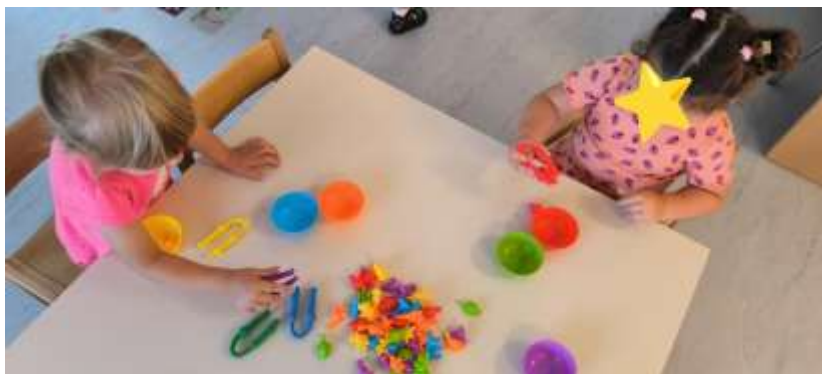
Slika 6. Razvrstavanje dinosaura prema boji