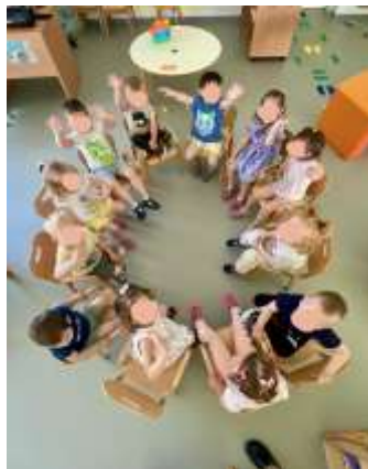
Slika 27. -formacija kruga – prstovne igre

strpljenje od strane odgojitelja. Nekolicina djece pokazuje razvijeno samopouzdanje u kontaktu s drugom djecom, što se može pripisati njihovom ranijem zajedničkom pohađanju vrtića u područnoj ustanovi prije premještanja u centralni objekt. Pojedina djeca razvijaju osobne preferencije prema određenim igračkama i aktivnostima, što doprinosi njihovom osjećaju identiteta i izbora. U početku pedagoške godine djeca nisu imala razvijenu sposobnost dijeljenja, čekanja na red niti izražen osjećaj empatije prema drugoj djeci. U konfliktnim situacijama, poput oduzimanja igračaka, neradnog dijeljenja kockica ili gurkanja u redu, većina djece tražila je pomoć odgojitelja za rješavanje problema i uspostavu reda. Općenito, tijekom godine djeca su pokazala vidljiv napredak u socio-emocionalnom razvoju. Većina je razvila osjećaj sigurnosti i pripadnosti unutar skupine kroz stabilan dnevni ritam, emocionalnu podršku odgojitelja i jasne granice. Dvoje djece ostvarilo je posebno snažnu emocionalnu povezanost s odgojiteljicama što je dodatno pridonijelo njihovom osjećaju sigurnosti i povjerenja, osobito u izazovnijim situacijama poput razdvajanja od roditelja ili prilagodbe na nove aktivnosti.