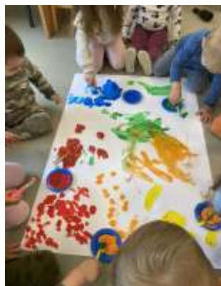
Slika 29. Zajednička likovna aktivnost

Tijekom pedagoške godine nekoliko je djece ostvarilo vidljiv napredak u govornom području te razvilo dobru i aktivnu komunikaciju s ostalom djecom u skupini. Takav napredak omogućio im je lakšu integraciju u skupinu i kvalitetnije međusobno povezivanje. S druge strane, dvoje djece još uvijek se uglavnom oslanja na neverbalnu komunikaciju, koristeći geste, mimiku i druge oblike neverbalnog izražavanja kako bi izrazili svoje potrebe i osjećaje. Za njih je važan individualizirani pristup i strpljivo poticanje verbalne komunikacije u skladu s njihovim sposobnostima i tempom razvoja. Djeca najviše uživaju u likovnim aktivnostima, osobito u slikanju kistovima koji su prilagođeni njihovoj dobi. Također vole slobodne oblike likovnog izražavanja, poput šaranja po različitim veličinama papira, modeliranje plastelinom te manipulaciju sitnim rasipnim materijalom, što im pruža mogućnost kreativnog izražaja i razvijanja fine motorike. Djeca također vole listati slikovnice tijekom kojih imenuju poznate predmete i likove, a odgojitelji koriste ove prilike za bogaćenje i proširenje njihovog rječnika, potičući ih na verbalno izražavanje i razvoj govora.