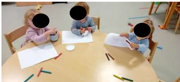
Slika 22. . Likovne aktivnosti: Slikanje pastelama

Dolaskom u vrtić djeca su svoje potrebe i želje uglavnom izražavala gestama, pogledom i neverbalnim signalima, što je u skladu s njihovom dobi i razvojnim mogućnostima. Tijekom pedagoške godine sustavno su poticane aktivnosti koje podržavaju rano jezično izražavanje – kroz pjesmice, brojalice, slikovnice, gestovne i prstovne igre, imitativne igre i svakodnevne verbalne poticaje. Uočen je vidljiv napredak: sve više djece pokušava imenovati predmete, oponašati riječi i aktivno sudjelovati u komunikaciji. Četvero djece sada verbalno izražava sve svoje potrebe i želje. Kroz poticajno okruženje i svakodnevne rutine omogućeno je izražavanje i stvaranje na djeci primjeren način, uz uvažavanje njihovog individualnog ritma razvoja. Djeca su tijekom pedagoške godine istraživala razne likovne tehnike poput crtanja drvenim bojama, kredama i flomasterima te slikanja pastelama, temperama i obojenim ledom. Sva su djeca rado sudjelovala u likovnim aktivnostima, izuzev jednog dječaka koji je pokazivao manji interes za takav oblik izražavanja pa čak i odbojnost prema mokrim tehnikama. Djeca se u ovoj dobi vole izražavati kroz pokret stoga su nam ples, pjesma i pokret kroz pjesmu svakodnevne aktivnosti.