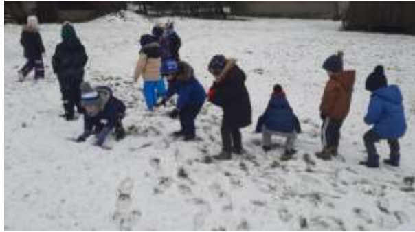
Slika 69. Igra na snijegu prilikom šetnje