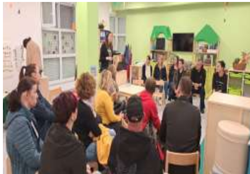
Slika 113. Suradnja s Osnovnom školom

Suradnja se uspostavljala na svim razinama i s različitim akterima i udrugama na području lokalne zajednice. Kroz različite aktivnosti surađivali smo s PP Prelog, DVD Draškovec, KIČ Grada Preloga, Udrugom žena Tratinčica iz Hemuševca, Komunalnim poduzećem Pre-Kom, te organizirali posjete skupini sukladno potrebama ostvarivanja plana i programa (posjet posjeti baka i djedova, roditelja). Prisustvovali smo i aktivno sudjelovali na raznim manifestacijama i priredbama koje su se organizirale u lokalnoj zajednici ili unutar ustanove ( Večer matematike, Božićna priredba, Fašnik u Prelogu, Božićni sajam, različite predstave, Sajam cvijeća).