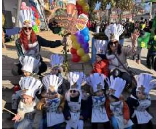
Slika 68. Sudjelovanje na Fašniku Grada Preloga

odabrana. Atmosfera je bila vrlo vesela i opuštena. Za zajedničku aktivnost, roditelji i djeca imali su zadatak da s djecom nacrtaju svoju obitelj kako bi to mogli dokumentirati i ovjekovječiti u mapama individualnog razvoja djece.