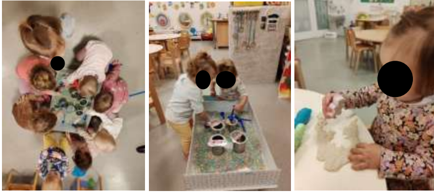
Slika 21. Igra rasipnim materijalom - obojena riža i modeliranje domaćim plastelinom