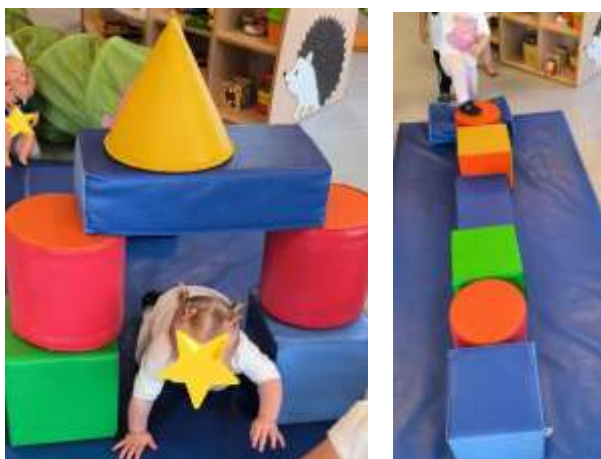
Slika 4. Poligon prepreka