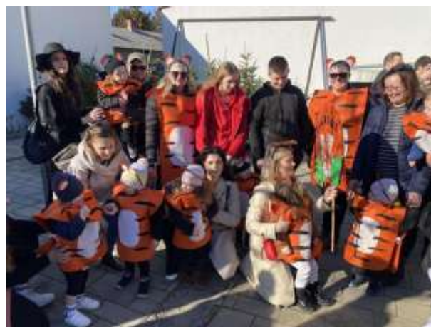
Slika 31. Fašnjak u Prelog Izvor: arhiva vrtića Izvor: arhiva vrtić

Skupina je sudjelovala i na manifestaciji “Fašnjak u Prelogu” a tema kostima bili su “Tigrići”. Uoči manifestacije, organizirana je kreativna radionica na kojoj su roditelji izrađivali kostime. Ova aktivnost potaknula je zajedničko stvaranje, suradnju i veselje, a djeca su ponosno sudjelovala u fašničkoj povorci odjevena u kostime koje su s roditeljima dovršili doma (ljepljenje repića) i upoznavanje s maskom.