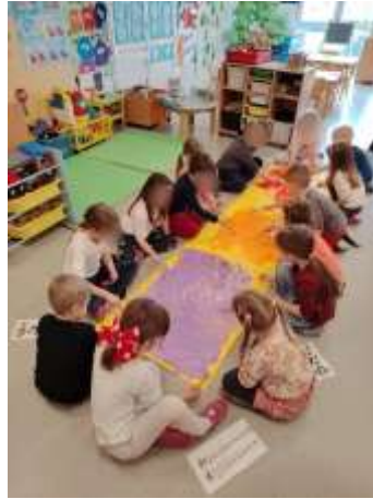
Slika 87. Slikanje u ritmu klasične glazbe

djece razviti slušnu percepciju, poticati ritmički osjećaj, poticati kreativnost i stvoriti pozitivno emocionalno ozračje. Djeci se osobito sviđela aktivnost slikanje u ritmu klasične glazbe kojom smo potaknule njihovo kreativno izražavanje.